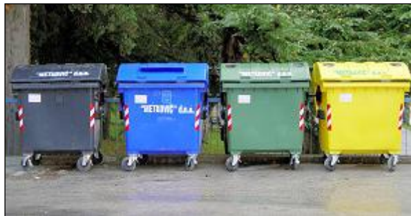
Slika 1. Izgled zelenog otoka

Otpad će se tu sortirati i pripremiti za transport, ovisno o pojedinoj vrsti i proslijediti tvrtkama ovlaštenima za obradu. Predviđaju se spremnici od 1100 l za papir, staklo, metale i PET plastiku.